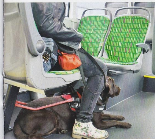
A látás- és hallássérültek is biztonságban vannak az új buszokon

technológiát, a buszgyártás folyamatát. Rövidfilmeket készítettünk annak érdekében, hogy mindenki megismerhesse az új buszokat, s azokat a lehetőségeket, amelyek újdonságként hathatnak számukra. Ezekben bemutattuk azt is, hogyan tudják használni a járműveket az épek, illetve a bármilyen fogyatékkal élők. A buszcseraprogram nyilvánosság-biztosításának részeként szakmai konferenciát is tartunk, hogy az új technológia iránt érdeklődőket tudással vértézhessék fel a területen már járatos szakemberek, s hogy ezáltal is felhívjuk ország-világ figyelmét a buszcseraprogramra, Kaposvár és a kaposváriak országosan is példa nélkül álló sikerére.