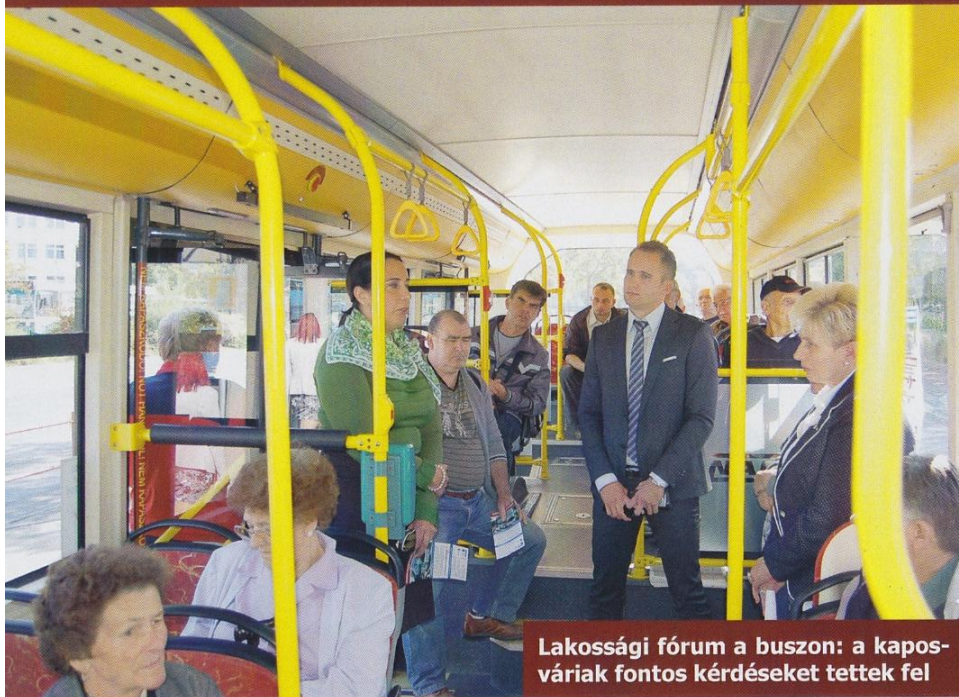
Lakossági fórum a buszon: a kaposváriak fontos kérdéseket tettek fel

A vállalati honlapokon – www.ktrt.hu ; www.kaposvaribuszcseraprogram.hu ; www.kaposholding.hu –, illetve a médián keresztül sajtóközleményekben, hirdetésekben, szórólapokon tudósítottuk a potenciális utasokat a buszcseraprogram elindulásáról, annak tartalmáról, a finanszírozásról, valamint a buszok gyártásának alakulásáról, átadásának időpontjáról. Lakossági fórumot hirdettünk meg számukra, hogy feltehessék kérdéseiket, s megtehessék észrevételeiket a programot jól ismerő, annak levezénylésében résztvevő szakembereknek. Közlekedési gépezetnek készülő tanulóknak szakmai tanulmányutat szerveztünk Budapestre, hogy megismerhessék a gyártási