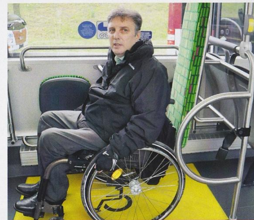
Nincsenek lépcsők: az idősek, a mozgássérültek és a babakocsival közlekedő kismamák is akadálytalanul buszozhatnak Kaposváron